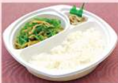
青椒肉絲ボックス