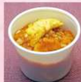
海老と玉子のチリソース