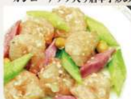
⑦海老の四川風塩味炒め