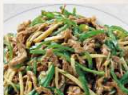
①牛肉とピーマンの細切り炒め