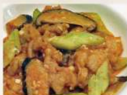
②豚肉のニンニクソース炒め