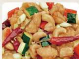
③鶏もも肉の カシューナッツ入り唐辛子炒め