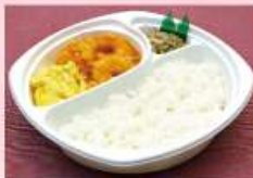
海老チリボックス