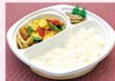
豚肉玉子炒めボックス