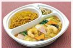
あんかけ焼きそばボックス