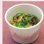
牛肉とピーマンの 細切り炒め