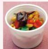
鶏モモ肉のカシューナッツ 入り唐辛子炒め