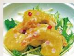
⑧海老フリッターのマヨネーズ和え