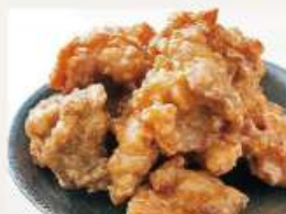
⑤鶏もも肉の唐揚げ