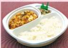
麻婆豆腐ボックス