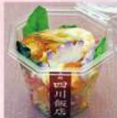
シェフの気まぐれ シャカシャカサラダ