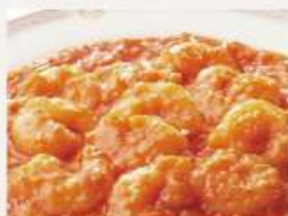
⑥海老のチリソース