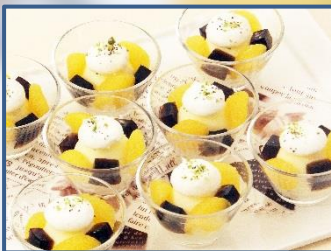
5 バニラアイスと 黒ビールのゼリー