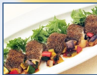
3 白身魚のロースト黒オリーブ風味 夏野菜のカポナータ添え