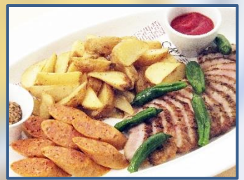
4 豚ほほ肉のスパイス焼きと ピリ辛フランク ポテト添え