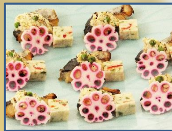
2 鱈のけんちん焼き