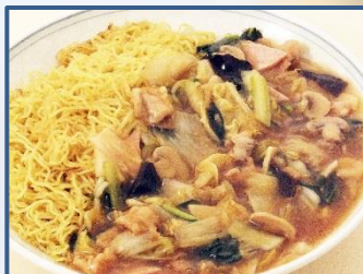
7 五目あんかけ焼きそば