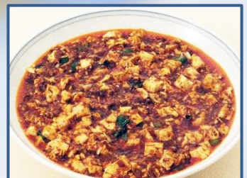
8 赤坂四川飯店特製麻婆豆腐 (白飯付)

チョイスメニューは追加料理としても1品500円(お一人様 税・サ込)でご利用いただけます。