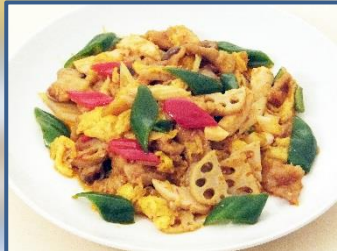
6 豚肉と煎り玉子の辛子炒め